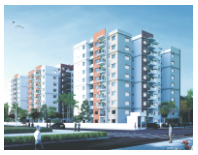
Nilgiri Heights Pocharam, Hyderabad 256 flats on 2.5 acres